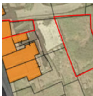
MAPPA CASA E TERRENO