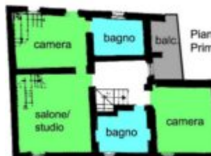
PLANIMETRIA PIANO PRIMO